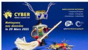
Powerpoint type de présentation